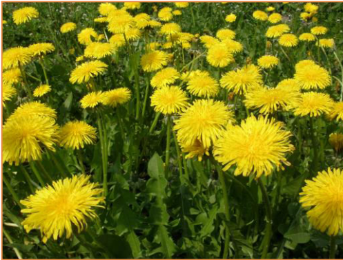
Paardenbloemen: een goede ontgifter! Een paar jonge blaadjes in de sla.

https://www.youtube.com/watch?v=tBGTtB_V3_4&feature=youtu.be idem voor zenuwpijn zoals ischias.