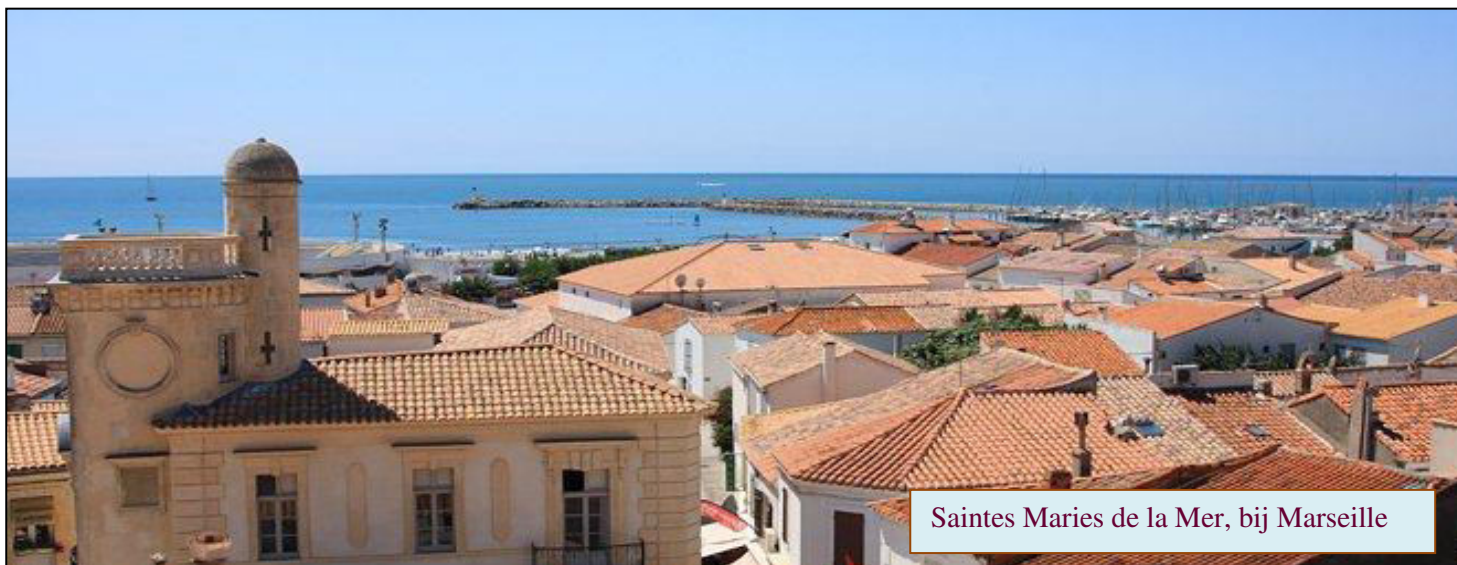
Saintes Maries de la Mer, bij Marseille

deze steen kun je goed gebruiken voor het verwijderen van energetische ‘groeisels’, het openen van kanalen die dan kunnen doorstromen, het is eigenlijk een energetische chirurgie die je dan toepast. Een steentje zo groot als je duimnagel kan al heel effectief zijn! Niet iets dat je bij je draagt. Als je op zoek bent naar een steen die oude dichtzittende delen in je energie openmaakt, is dit een heel goede.