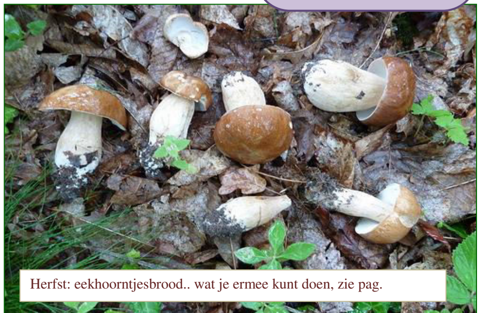
Herfst: eekhoortjesbrood.. wat je ermee kunt doen, zie pag.

Maansverduistering in de nacht van zondag op maandag (27-28 september) tussen 02.00 en 07.00 uur. Als je de kans krijgt, ga kijken want de maan staat dan ook ongeveer op het punt het dichtste bij de aarde (de apogee heet dat officieel) en ziet er dus groter uit dan gewoonlijk. Nu nog hopen dat het weer meewerkt!